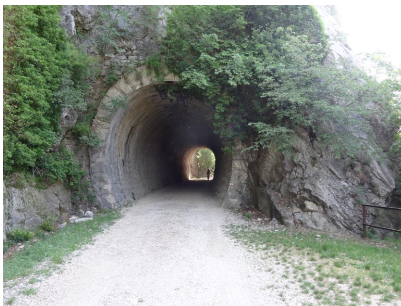
Tracciato vecchia ferrovia