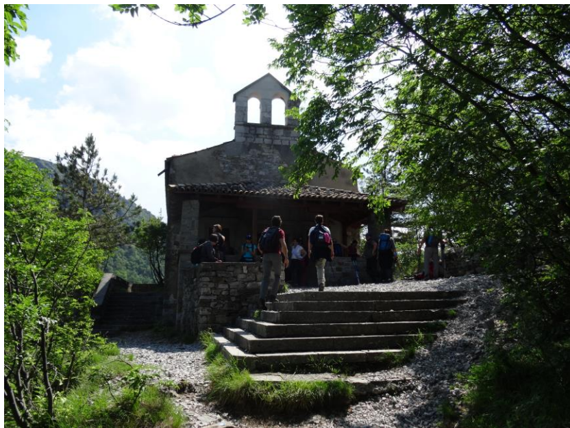
Santa Maria in Siaris