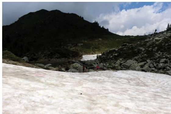
Piccolo nevaio, a fine giugno 2021, a Forcella Scanaiol